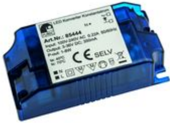
Konstantstrom Konverter LED Konverter 350mA 1W-8W 3-36V Artikel-Nr.: PHE444