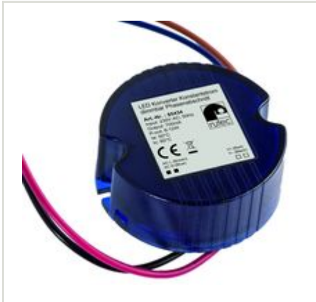
Konstantstrom Konverter Dimmbar LED Konverter 700mA 6W-12W Artikel-Nr.: PHE434